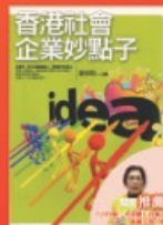
香港社會企業妙點子