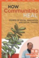
How Communities Heal