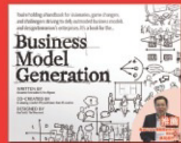
Business Model Generation